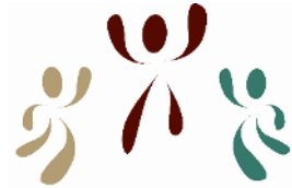
École des Trois-Portages